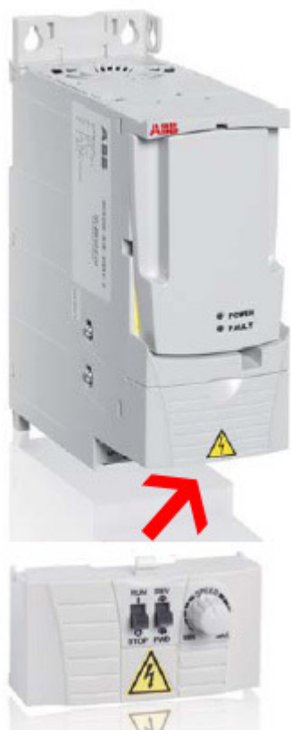
Potenciometr MPOT-01 (pro ACS 355)