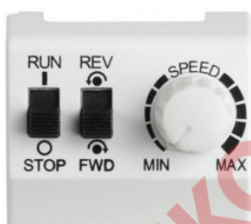
Potenciometr ACS55-POT (pro ACS 55)

U měničů ACS 55 a ACS 355 je možno použít potenciometr, který se zasune přímo do I/O přípojek měniče. Modul obsahuje potenciometr a dva přepínače: start/stop, vpřed/vzad. Pro potenciometr není potřebný externí zdroj napájení.