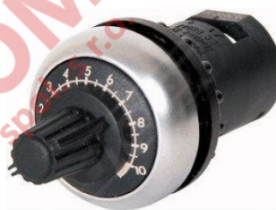
Externí potenciometr M22-R10K